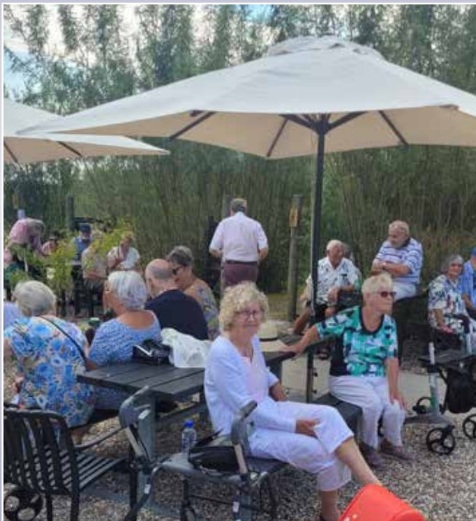
Heldigvis for ingen vild ;:-p