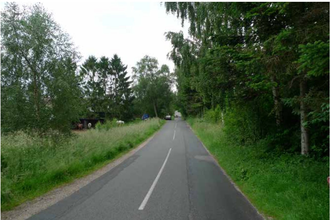
Vejen tegner et snit gennem landskabets former.

Kulturhistorisk Undersøgelse. Pilotprojekt, Nationalpark Kongernes Nordsjælland. Holbo Herreds Kulturhistoriske Centre 2005.