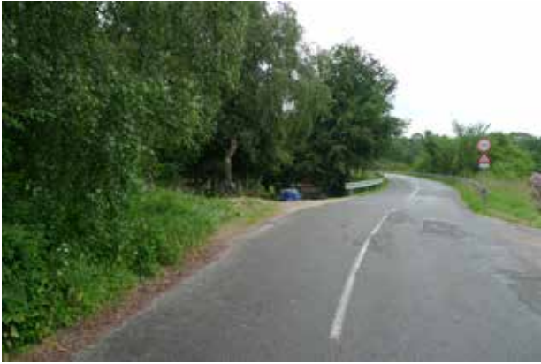
Ved jernbanebroen er det rette forløb ændret.

Særligt langs Jagtvej er der etableret en række husmandssteder. Det giver vejen sit eget præg, der minder om typiske statshusmandsudstyknings.