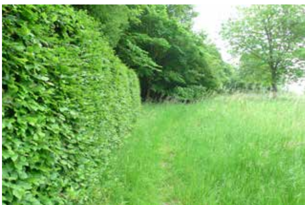
Vejen er ført uden om Gl. Grønholt Vang og der er slet ingen visuel forbindelse til det gamle forløb gennem skoven - selvom stien inde i skoven findes endnu.

Ved krydset Jagtvej/Grønholtvangen kunne man også med fordel sikre, at beplantningen ikke hindrer den visuelle oplevelse af de lange lige vejforløb.