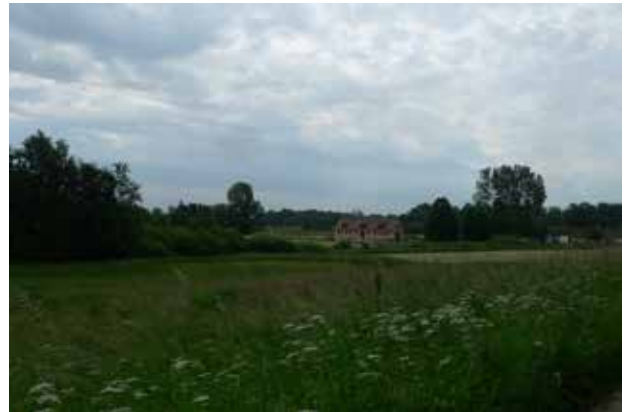
Parforcevejene passerer gennem et småskalalandskab med mange hegn og diger.

Bebyggelsen i området er ikke funktionelt eller historisk relateret til parforcevejene og er derfor ikke beskrevet.