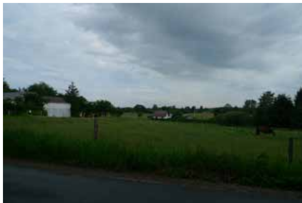
Udsigterne fra parforcevejene afspejler morænefladens let kuperede karakter.

Parforcevejene løber gennem morænebakker med dødisrelief. Det afspejles af det bølgede og varierede landskabsbillede, man får fra vejen.