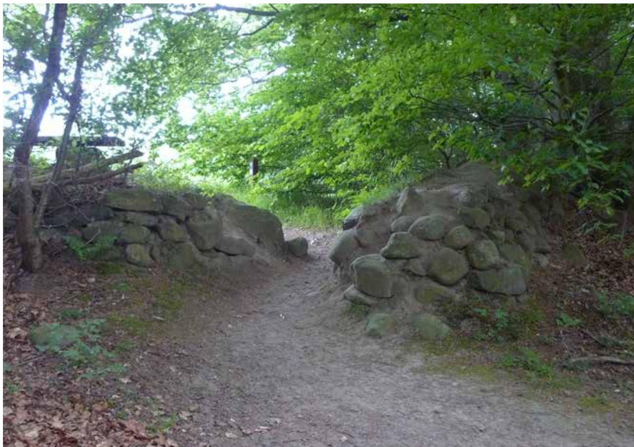
Efter parforcesystemet gik ud af brug, er parforcevejen gennem Gl. Grønholt Vang blevet lukket med stendiger i forbindelse med udskiftningen af skovområderne.

Vejene bevæger sig igennem åbne landskaber vekslende med skovområder. Denne landskabelige sammenhæng kan næppe sammenlignes med det landskab vejene er anlagt i og som havde mindre skarpe grænser mellem skov og mark. Det eksisterende landskabsbillede fortæller derimod om udskiftningshistorien, ligesom husmandsstederne, der i nyere tid er anlagt langs de gamle parforceveje. Disse forhold anses for mindre væsentlige i relation til parforcefortællingen.