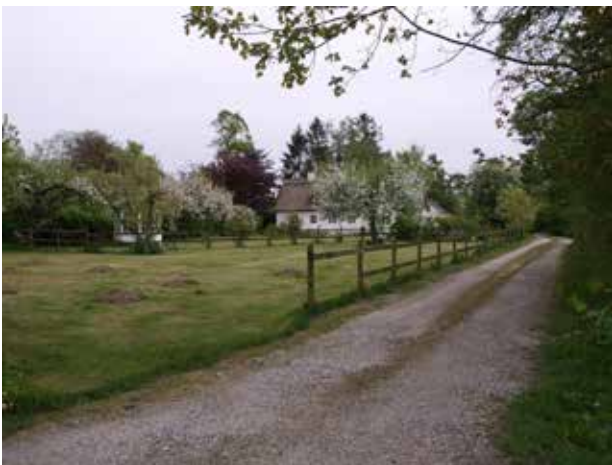
Æblehave ved ankomsten til Gunderød, syd for Donsevej. Ejendommen er en af Gunderøds ældre husmandssteder.