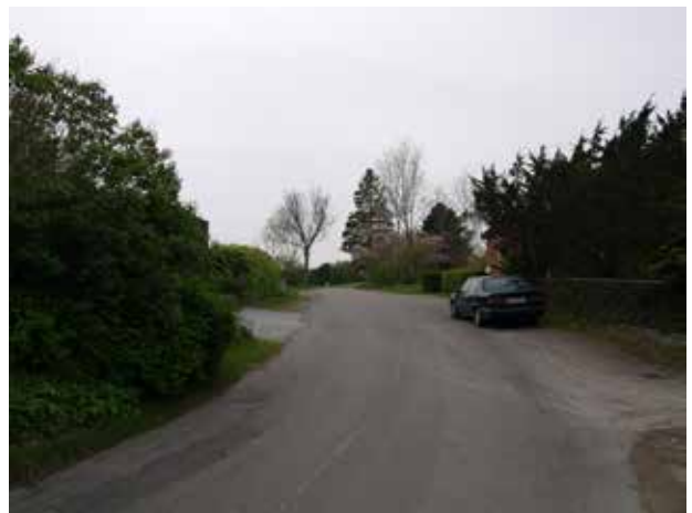
Kig mod vest ad Gunderødvej.