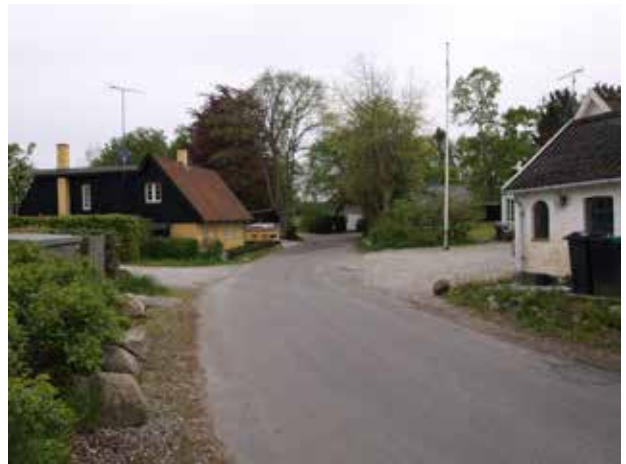
Kig ved Donsevej mod syd ad Damsholtevej.