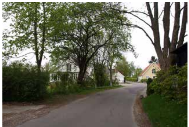
Kig fra syd mod Gunderødgård.