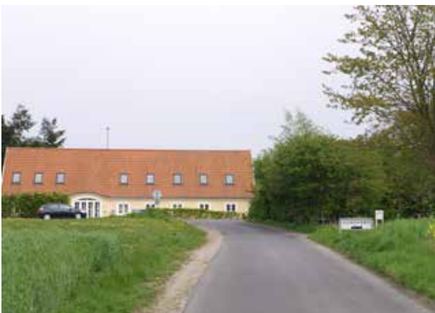
Kig fra Donsevej mod Gunderødgård.

Gadeforløbet i Gunderød er snoet. Både Gunderødvej, Damsholtevej og Donsevej slynger sig igennem landsbyen og forbinder den med det øvrige overordnede vejnet. Disse veje er 'alfarveje' og har indtil åbningen af Kongevejene og etableringen af Isterødvejen været transportårer for landsbyens bønder. De er fint tilpasset landskabets fald og stigninger, hvorfor de slynger sig.