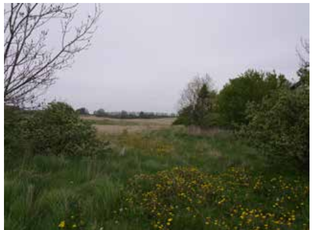
Eng vest for Gunderød og kig mod nord.