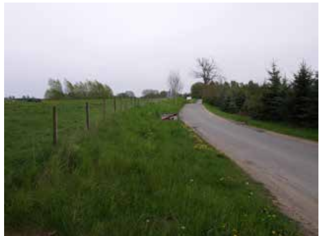
Kig ad Damsholtevej.