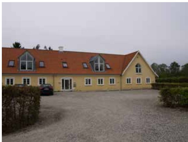
Gunderødgård er en af de oprindelige gårde, som kan spores helt tilbage til udskiftningen af Gunderød.