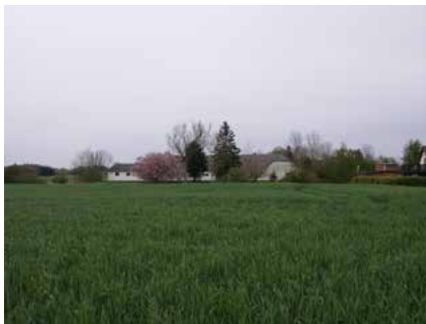
Kig fra Donsevej mod nord hen over markerne. Det er den vestligste gård i Gunderød, som kan spores helt tilbage til udskiftningen. Den firelængede gård er den vestlige afrunding af Gunderød.