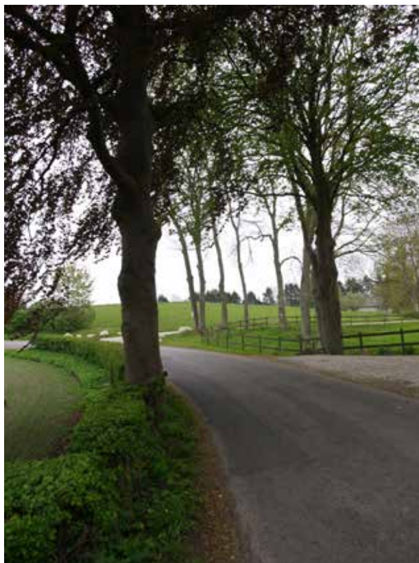
Kig af Gunderødvej mod øst, nord for Damgaard.

Flere steder i Gunderød åbnes der langs vejen op for kig til markerne omkring landsbyen. Disse kig understreger kontrasten mellem det åbne landskab og Gunderøds landsbykarakter. Landsbyens gadekær ligger centralt i byen og formidler historien om vanding af kreaturer eller anvendelse som branddam.