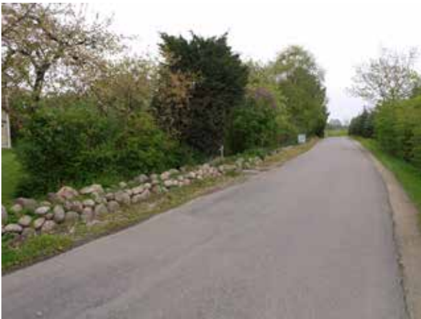
Kig ad Damsholtevej mod øst.