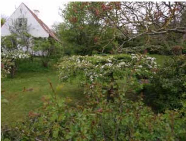
Æblehave vest for Damgaard.