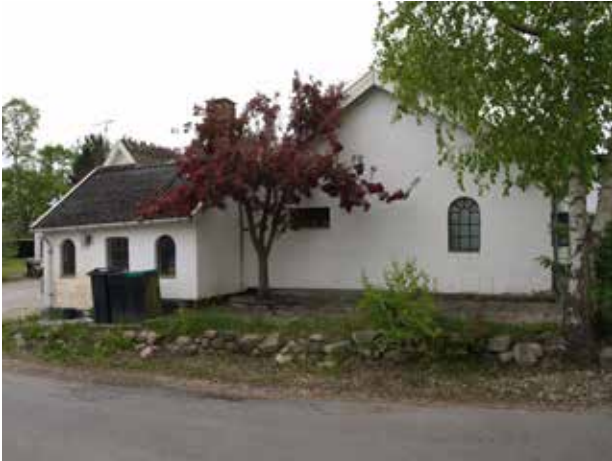
Bolig på hjørnet af Donsevej og Damsholtevej som oprindeligt er et af byens husmandssteder.