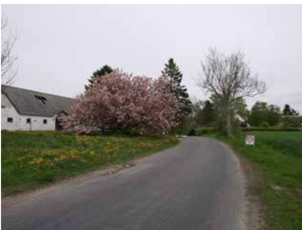
Kig mod øst af Gunderødvej mod Gunderød.