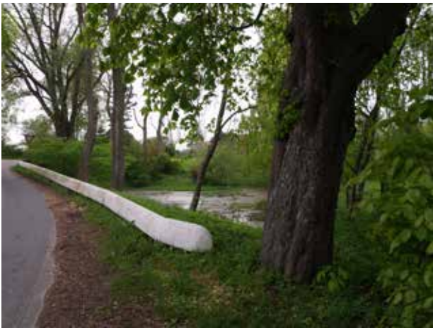
Gadekær i Gunderød.