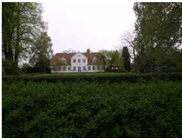
Damgaard set fra nord. Damgaard er en af Gunderøds mere markante gårde med et velproportioneret stuehus og central placering i byen.

Bebyggelsen i Gunderød består hovedsagligt af to bygningstypologier. De tre- og firelængede gårde, som fremgår med rødt af kortet side 4, er de dominerende bygninger i Gunderød. Indimellem ligger huse, som også kan aflæses af kortet fra 1807 (side 6). Husene har forsynet de større gårde med den nødvendige arbejdskraft til landbrugsdriften i området.