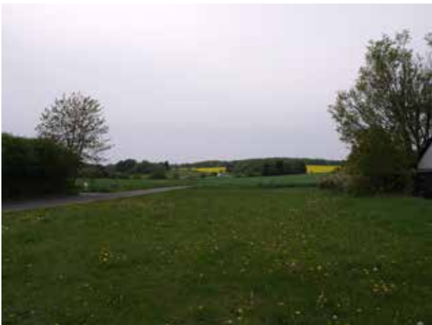
Kig fra Gunderød mod vest og Donsevej.

Landskabet omkring Gunderød er karakteriseret ved de åbne marker, mens der i Gunderød findes tættere beplantning i kraft af landsbyens haver. Den tættere beplantning undersætter landsbyens rumlige forløb og oplevelsen af at være i en landsby.