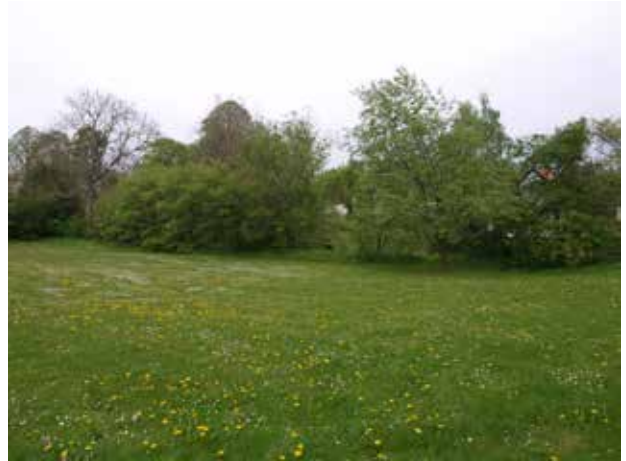
Gammel dige øst for Gunderødgård.