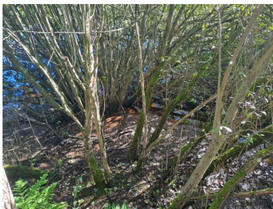
Figur 2: Træ i udløbet fra søen til drængrøft