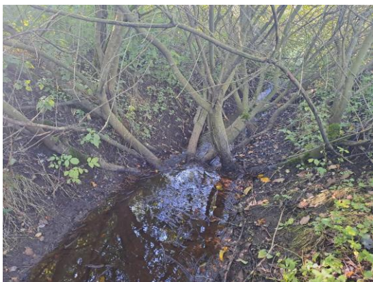
Figur 3: Træ i drængrøft ca. 40 meter nedstrøms søen

Søen har et overfladeareal på ca. 19.000m 2 inkl. en smal bredzone med fugtigbundsplanter.