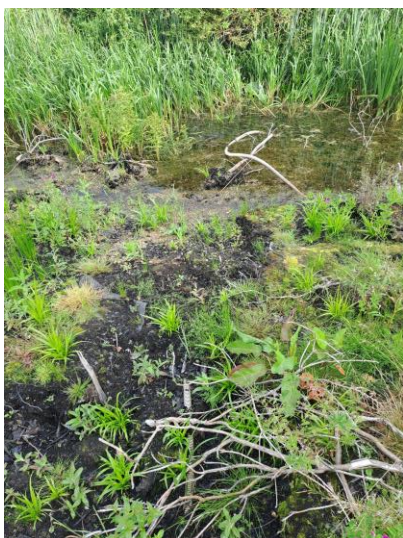
Billede 2: De tekniske installationer ligger frit i terrænet

Ved at udrette brinkerne, nedtage springvandet og de tekniske installationer, fjerne plast membran samt oprensning for sediment og vegetation vil ejer forbedre naturindholdet i søen. Naturstenene ved og i søen vil blive genbrugt og indarbejdet i projektet, så de kan medvirke til at fremme naturindholdet og herlighedsværdien omkring søen. Søen har et overfladeareal på ca. 250m 2 inkl. en smal bredzone med fugtigbundsplanter.