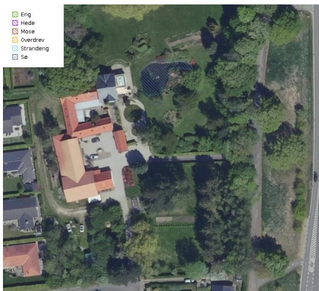
Figur 1: Oversigtskort over ansøgningsområdet

Fredensborg Kommune har den 19-08-2024 mundtligt modtaget en ansøgning fra ejer ifm. en besigtigelse af området. Ansøgningen blev suppleret af en skriftlig ansøgning den 20-08-2024. Der ansøges om dispensation fra naturbeskyttelseslovens § 3 til oprensning af sø og nedtagning af et springvand, der er etableret i søen.