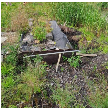
Billede 3: Springvandet består af beton, sten og plastik membran