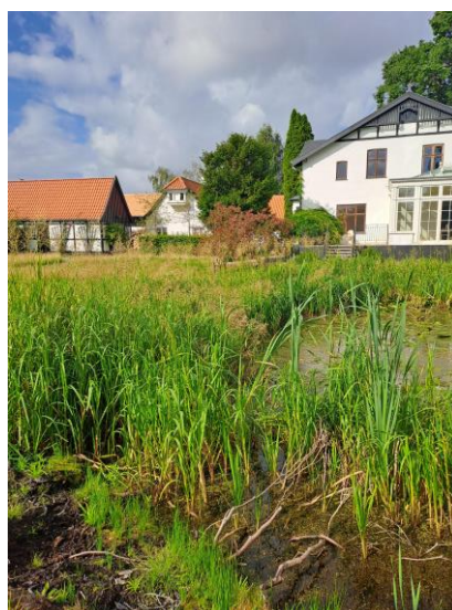
Billede 4: Vegetationen er meget udbredt i søen