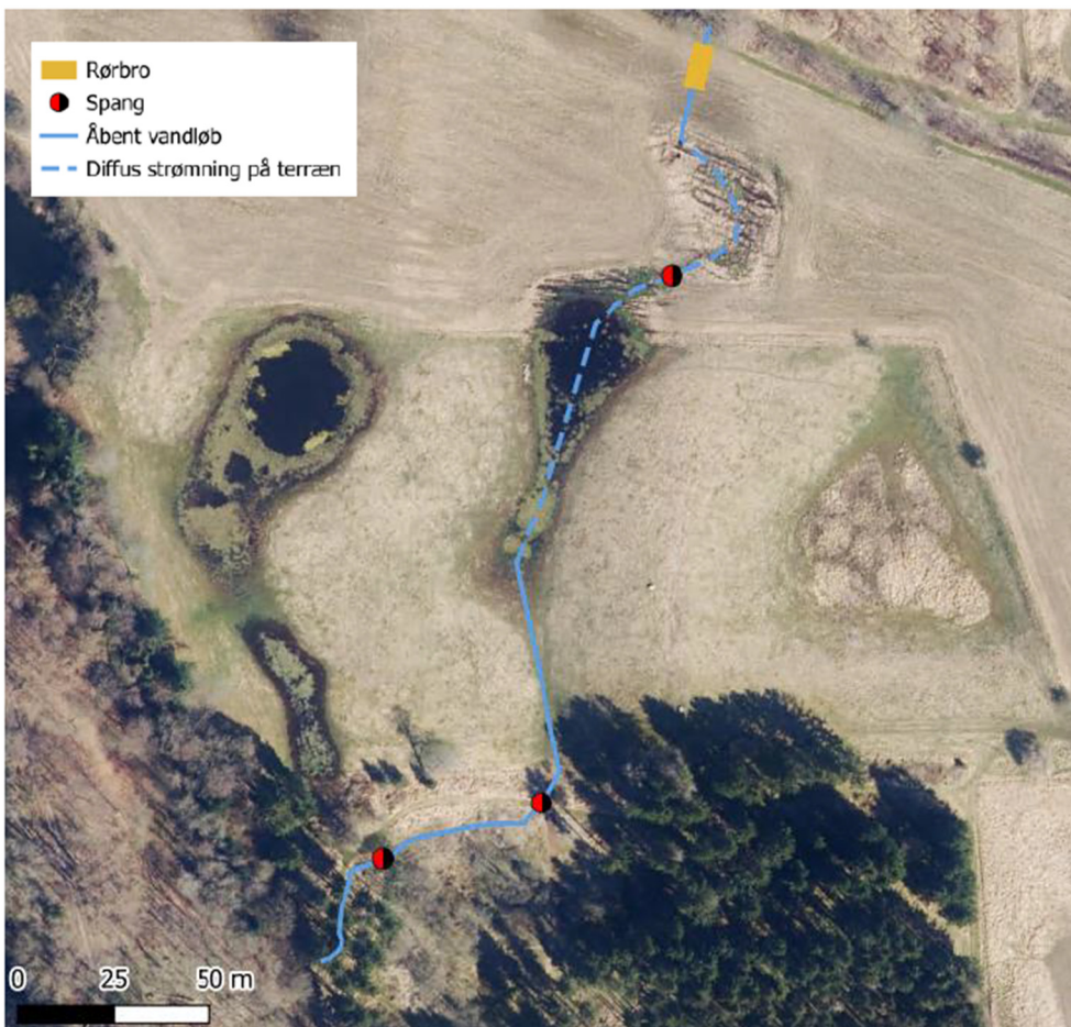
Kort visende det planlagte projekt.