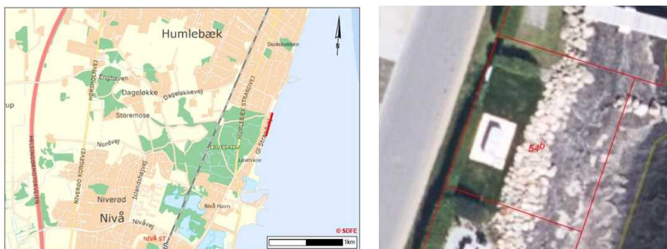
Figur 1, situationsplan, der viser anlæggets placering, målestok hhv. 1:50.000 og ca. 1:250.

På figur 1 ses en situationsplan, der viser anlæggets placering.