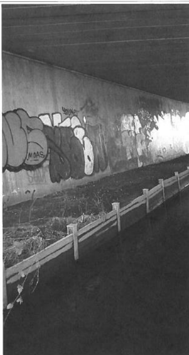
Foto af eksisterende forhold under motorvejsbroen. Hvor den lodrette kant/faskine skal nedlægges og anlægges med et skråningsanlæg på 45 grader og med sten på brinken for at undgå erosion.

Oversigtskort i målestok eks. 1:50.000. Målestok angives