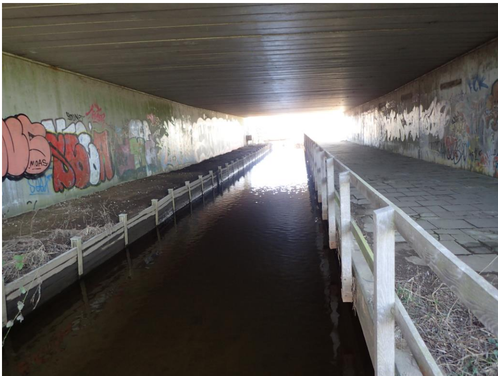
Billede 1: Viser den sydlige (venstre side af billedet) brink af Nivåen, hvor brinken er sat med I-jern og brædder på strækningen mellem vandløbsstationering 4960 - 5010. I-jern og brædder ønskes fjernet og i stedet etableres et skråningsanlæg på 1:1.

skråningsanlægget under broen, så odderen uhindret kan komme op og færdes på brinken og derved krydse under motorvejsbroen.